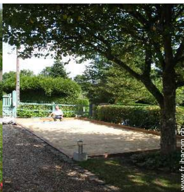
aménagement de loisirs