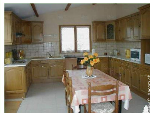
grande cuisine indépendante

Médecin 4km Infirmière 1,5km Hôpital 25km