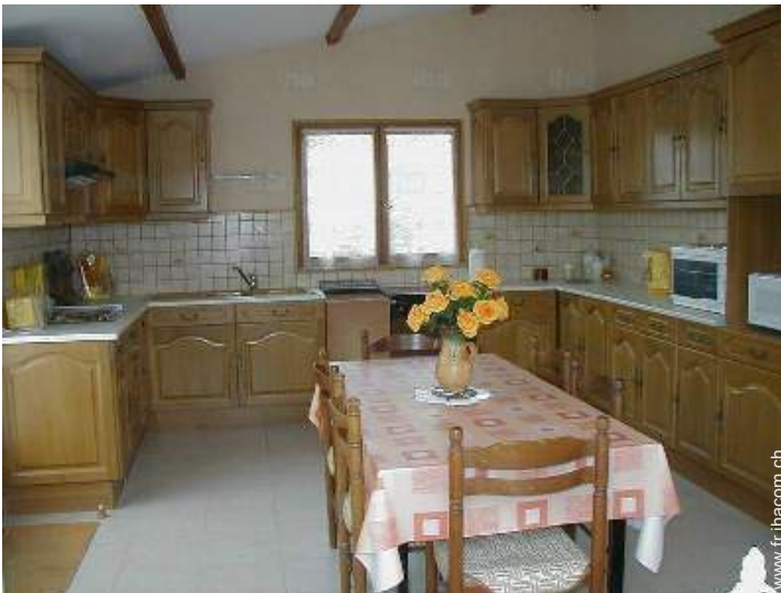
grande cuisine indépendante