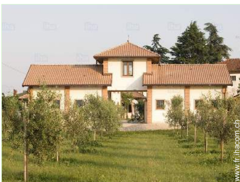
vue de la propriété