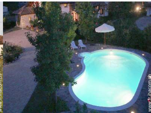
vue de la propriété