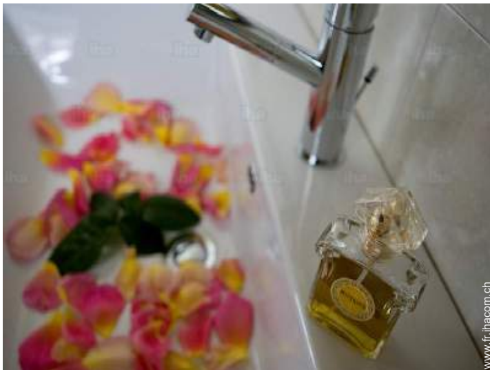
salle(s) de bain