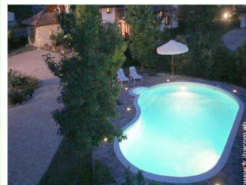
vue sur piscine