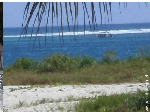
vue depuis le patio