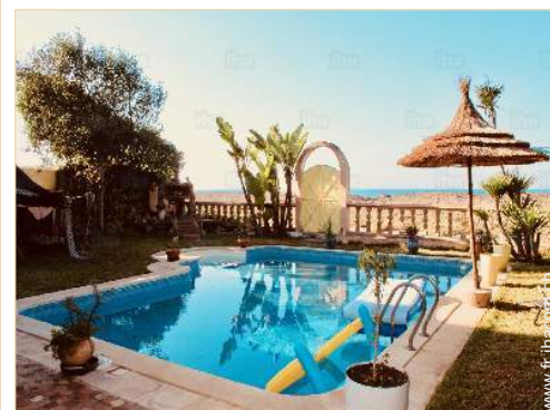
vue depuis la piscine