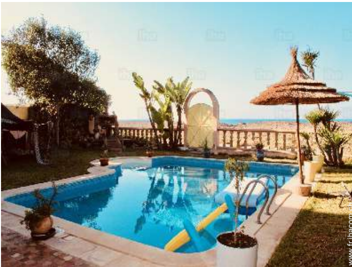
vue depuis la piscine