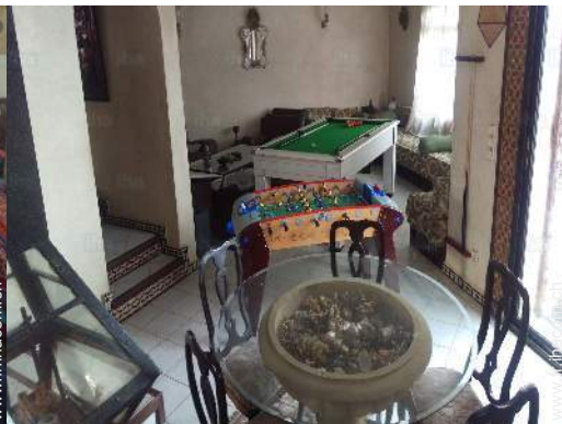
table de billard