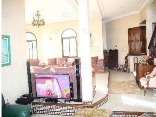
vue depuis le séjour