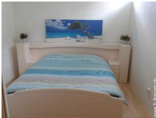
Couchage - lit(s)