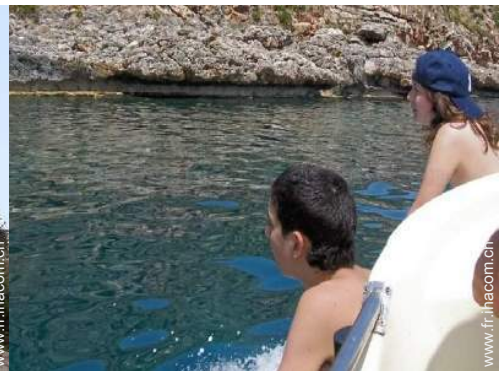
excursion en bateau