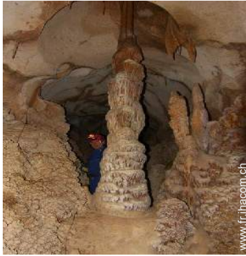
loisirs de montagne à proximité