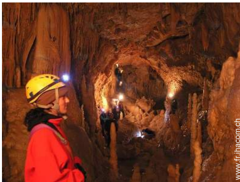
loisirs de montagne à proximité