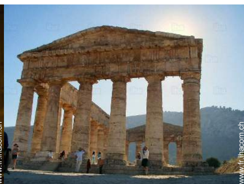
Villes à proximité