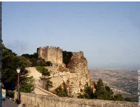
Villes à proximité