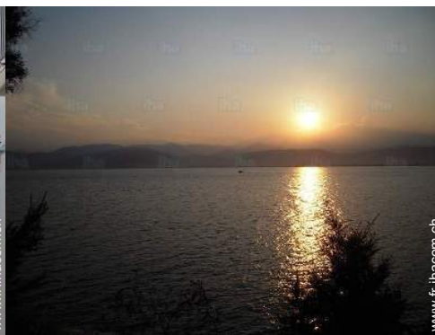
vue sur coucher de soleil