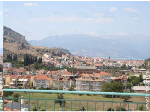
vue sur mer