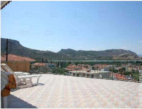
vue depuis l'appartement