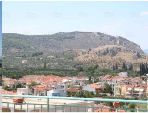
vue depuis l'appartement