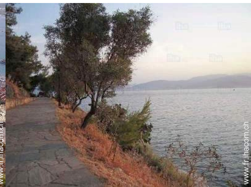
chemin de promenade