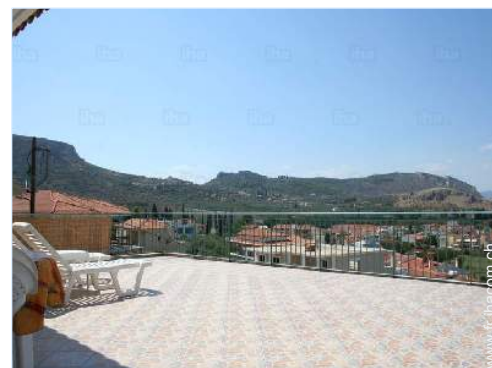
vue depuis l'appartement