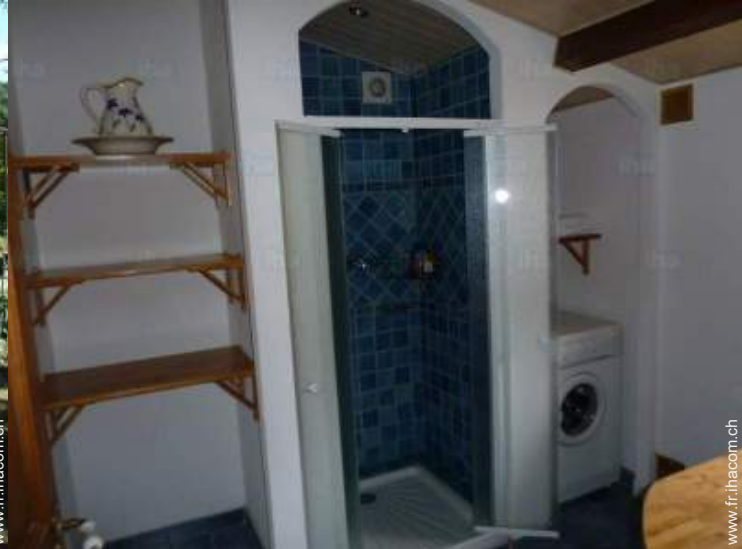
salle(s) de douche