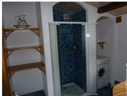
salle(s) de douche