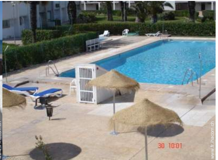
piscine dans la résidence