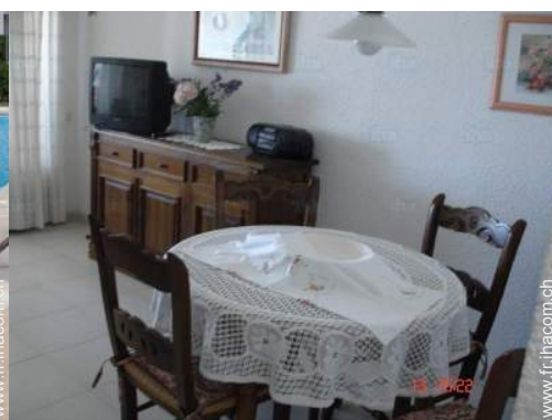
piscine dans la résidence