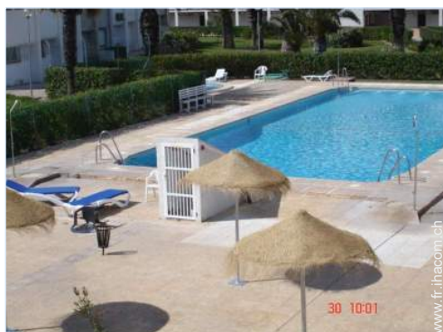
piscine dans la résidence