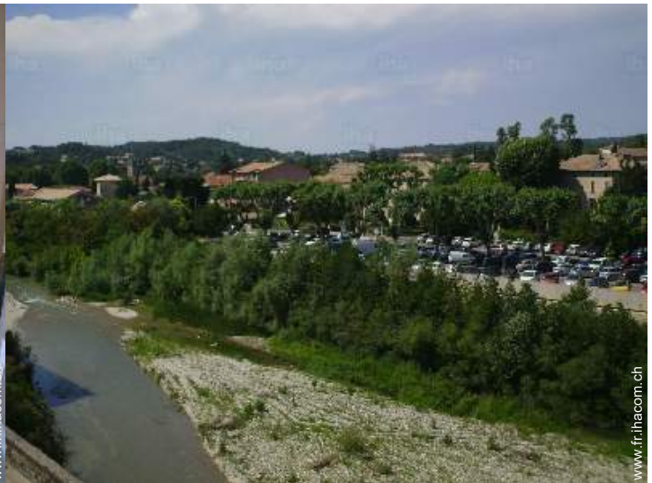
vue depuis l'appartement