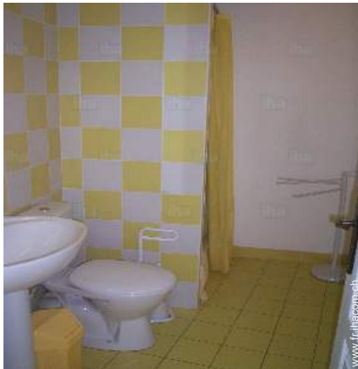
salle(s) de douche